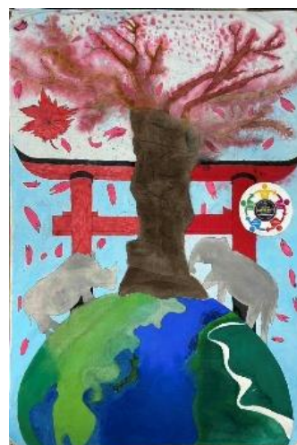
▲壁画コンテスト 佳作 クラーク記念国際高等学校 さいたまキャンパス・キークラブ