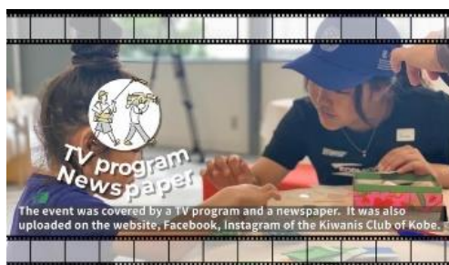
▲奉仕プロジェクト賞 2 位 神戸キワニスクラブ 「海洋プラスチック・アクセサリー作りワークショップ」

日本は、先にご紹介した展示が 1 位、 神戸クラブの「海洋プラスチック・アクセサリー作りワークショップ」で応募した奉仕プロジェクトが 2 位、 文化プレゼンテーションが 1 位、 更には壁画コンテストでクラーク記念国際高等学校さいたまキャンパス・キークラブの作品が佳作に入選するなど、大健闘でした。